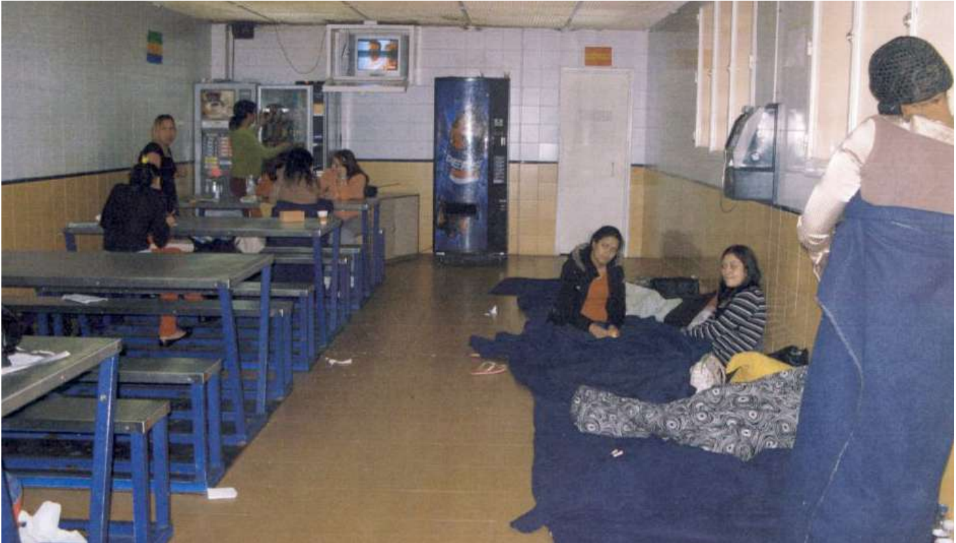
تم فتح ملف إرجاع بنسبة 40 بالمائة للمهاجرات السريات.

اليمنية المتطرفة التي تحدثت عن "خطر وجود غزو" من المهاجرين.