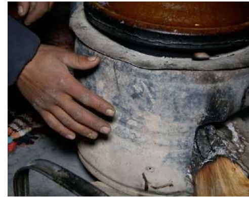
الحطب بلأي ثمن .