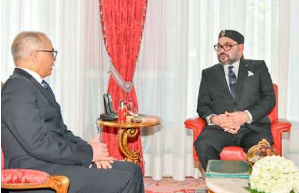
دفتتر التحملات حدده الملك عندما قال هذا النموذج ينبغي أن يكون مغربيا- مغربيا.