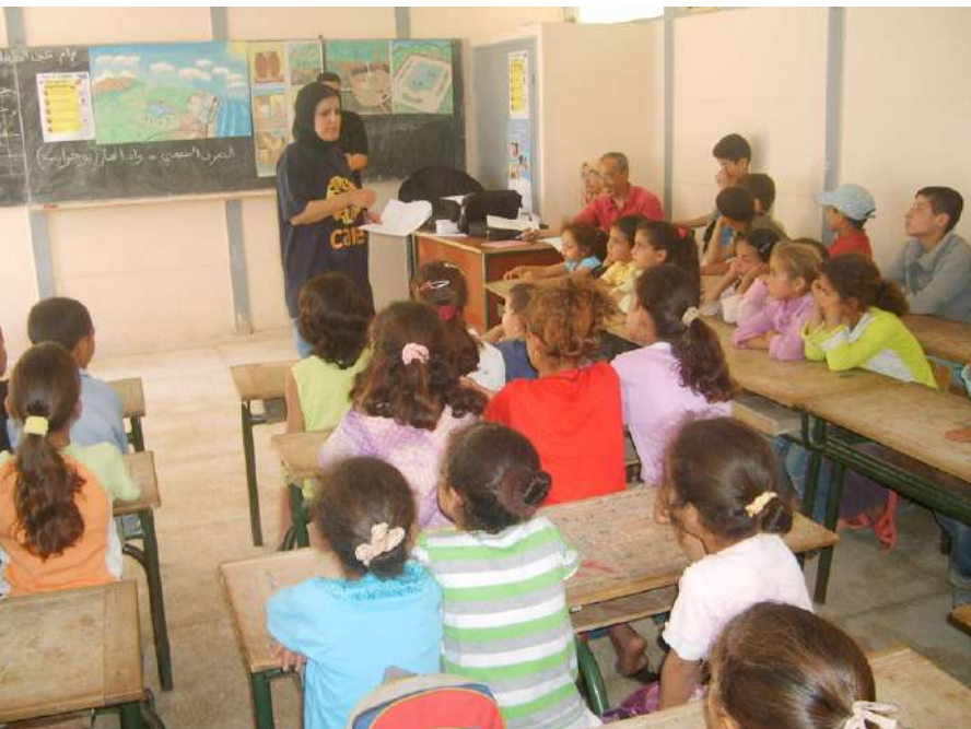
أمام زحف الهواتف واللوحات الذكية يمكن أن يعزل الطفل أيضاً عن أسرته.

وقال المسؤول الموريتاني إن الأسر قامت ببناء حضانات أهلية تسمح للنساء بالذهاب إلى العمل، وهذه الحضانات تعتمد بشكل أساسي على الأسر في كل شيء. «