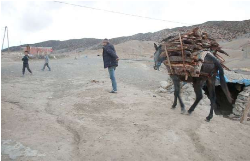
تكلفة الحطب فوق طاقة الناس على التحمل.

الغابوي بالمنطقة ويؤثر على ثروتها الحيوانية، في إيقاع رتيب وصمت يخيم على كل ركن. جل الناس هناك يفرون إلى داخل البيوت بحثاً عن أقرب ركن من موقد النار، ومن يستطيعون قطع المسافة بين مكان سكنهم ومركز "تونفيت" يتكدسون داخل مقاه معدودة على رؤوس الأصابع توفر بعض من التسلية عبر شاشة التلفاز ودفء لقاء فنجان قهوة أو كأس شاي... ■